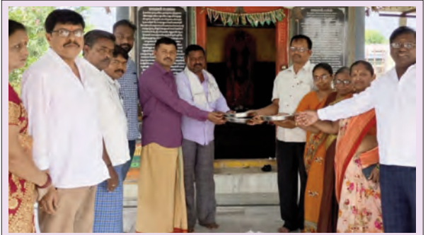
అలయ కమిటీ సభ్యులకు స్ట్రీట్ ఫ్లెట్లు అందజేస్తున్న దాతలు