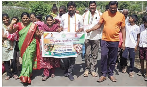
మాదారంలో నిర్వహిస్తున్న అమ్మ మాట అంగన్వాడీ బాట